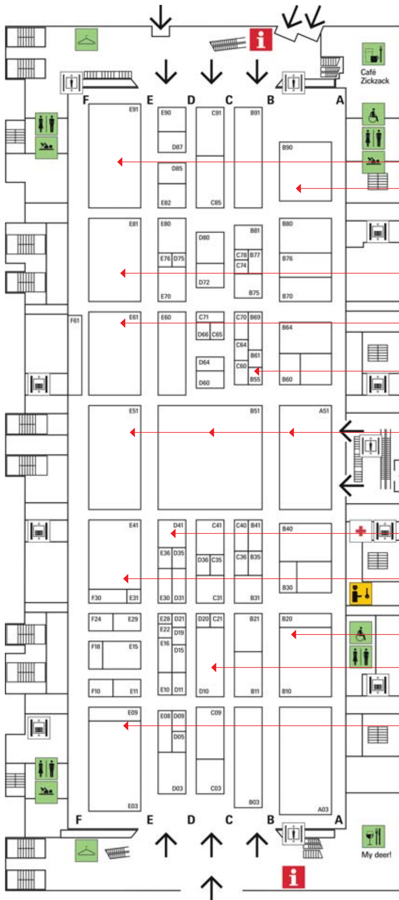
Halle Hall 12.0